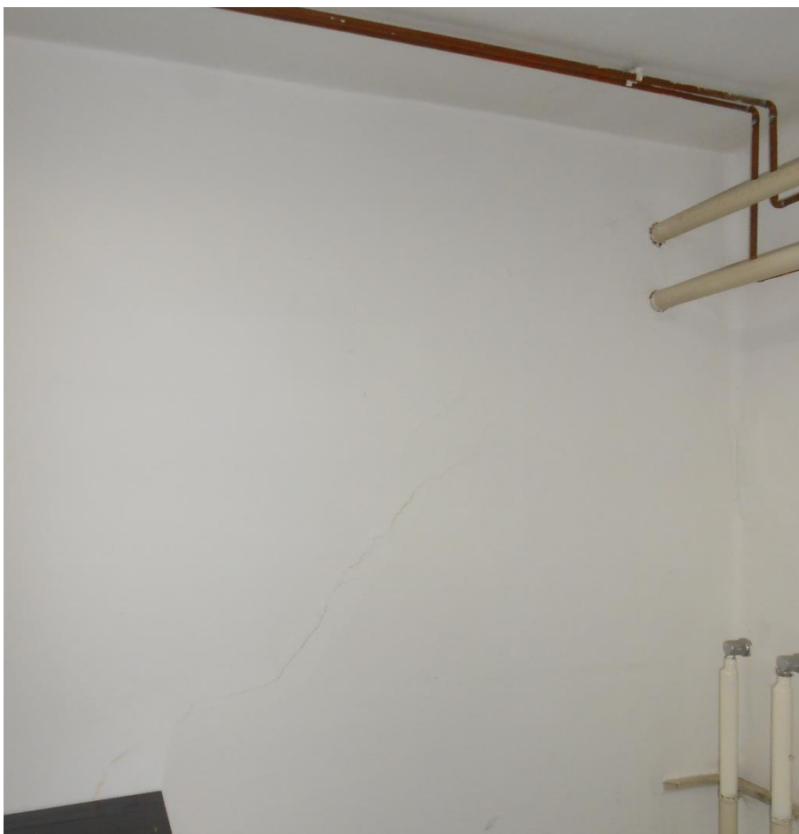
Slika šte. 5: fotografija poševne strižne razpoke zidu