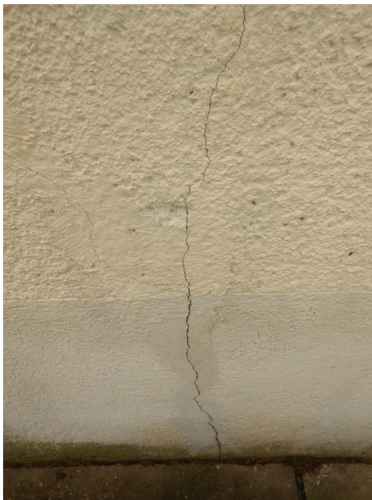
Slika šte. 4: razpoka zidnega nastavka fasadnega zidu

Domnevamo, da je do diferenčnega posedanja mestoma prišlo med drugim tudi zaradi zamašenih jaškov navpičnih odtokov strešnih žlebov in posledično izpiranja finih frakcij temeljnih tal skozi desetletja.