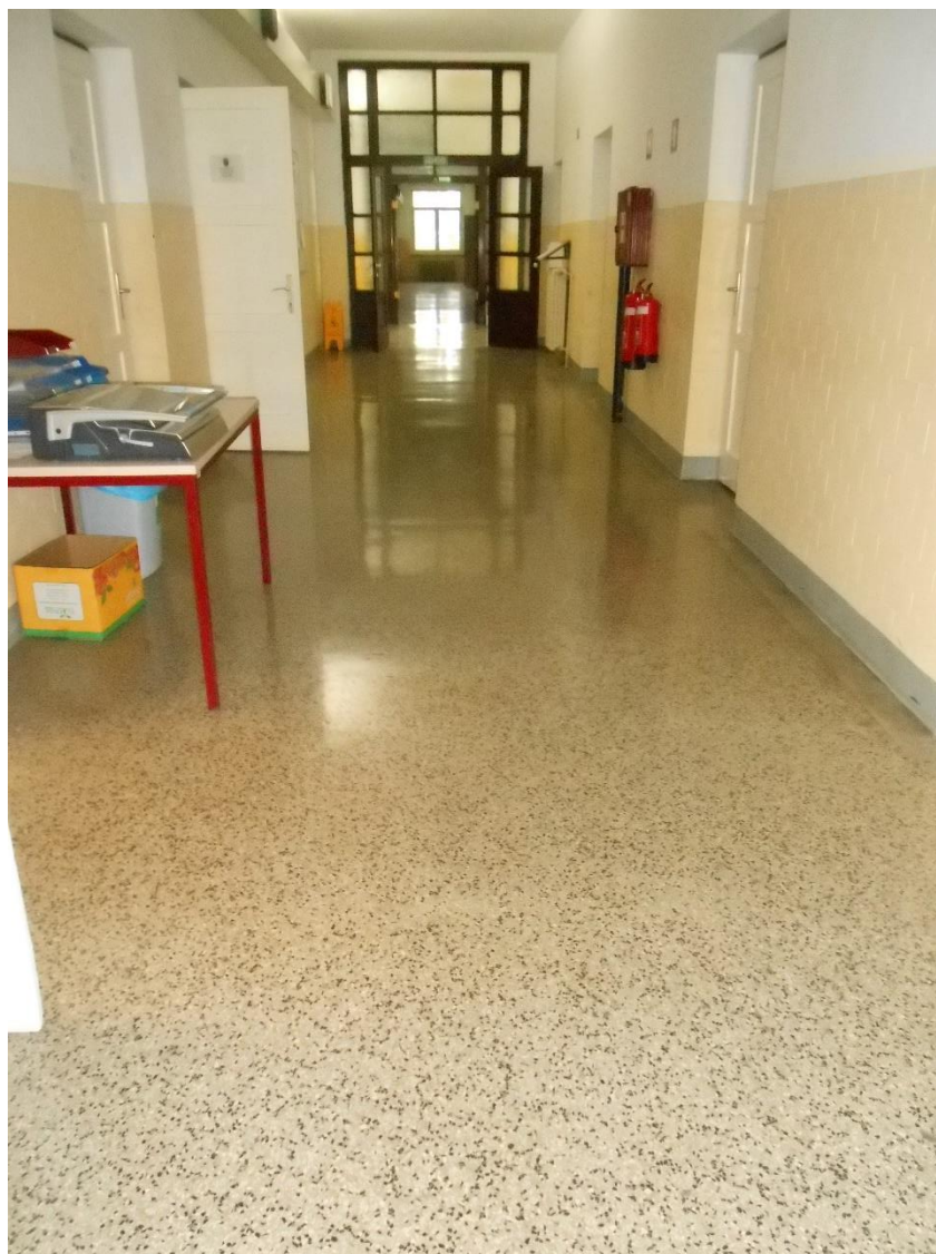
Slika šte. 9: prečno razpokan teraco hodnika

Teraco tlak hodnika v pritličju in nadstropju je razpokan, predvsem v prečni smeri a tudi po sredi vzdolžno po celi dolžini hodnika, kar je spričo nedilatiranosti pričakovano (slika šte. 7). Te poškodbe, ki načeloma niso konstrukcijske, v nadaljevanju niso obravnavane (lahko pa se jih sanira z urezovanjem dilatacij in polnitvijo s trajno elastičnimi kiti).