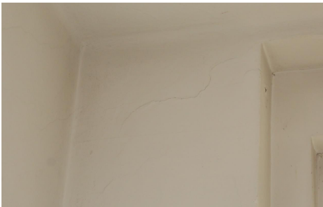
Slika šte. 6: fotografija razpoke od vogala okna v nadstropju južne čelne stene